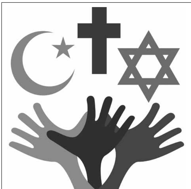
Der Dialog zwischen den Religionen kann ein Beitrag zum Frieden sein.

Es gibt fast keine Gemeinden in Bayern, in denen nicht Mitbürger anderer Religionsgemeinschaften wohnen. Oft fehlen bei diesen Religionsgemeinschaften strukturell bedingt institutionelle Gesprächspartner. Umso wichtiger werden persönliche Gespräche und Kontakte. Selbst wenn solche Kontakte vor Ort nicht vorhanden sind, kann man für eine weltoffene und dialogbereite Gemeinde eintreten. Es verlangt Mut und Zivilcourage, innerhalb der eigenen Gemeinde oder Pfarrei offen und konstruktiv auf Menschen mit einer gänzlich anderen Einstellung zuzugehen und die eigene Meinung klar und unmissverständlich, aber ohne verletzende Worte zu vertreten. Dadurch werden nicht sofort aus Gegnern Freunde, aber es wird im Vertrauen auf den Heiligen Geist das Fundament für ein verträgliches Miteinander gelegt. Abbau von Vorurteilen und Aufklärung sind keine leichte, aber dringende Aufgabe in und außerhalb der Pfarrgemeinde.