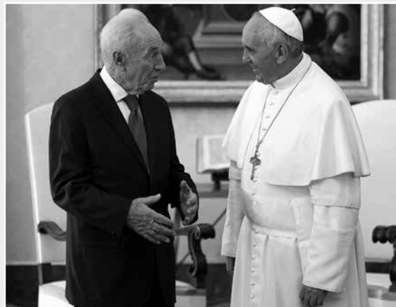
Shimon Peres und Papst Franziskus

Das Buch der Bücher fordert uns dazu auf, auf dem Weg des Friedens zu gehen. Es verlangt von uns, dass wir uns für die Verwirklichung des Friedens bemühen. (...) Friede passiert nicht einfach so. Er verlangt nach Opfern und nach Kompromissen. Ohne Frieden sind wir nicht vollständig. Wir haben den Auftrag der Mitmenschlichkeit zu erfüllen. Sogar wenn der Friede scheinbar weit weg ist, müssen wir uns bemühen, ihn wieder näher heranzuführen. (...) Dann wird er sich fortsetzen durch uns alle, so wie es bei